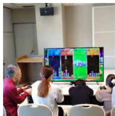
昨年の e- スポーツの様子