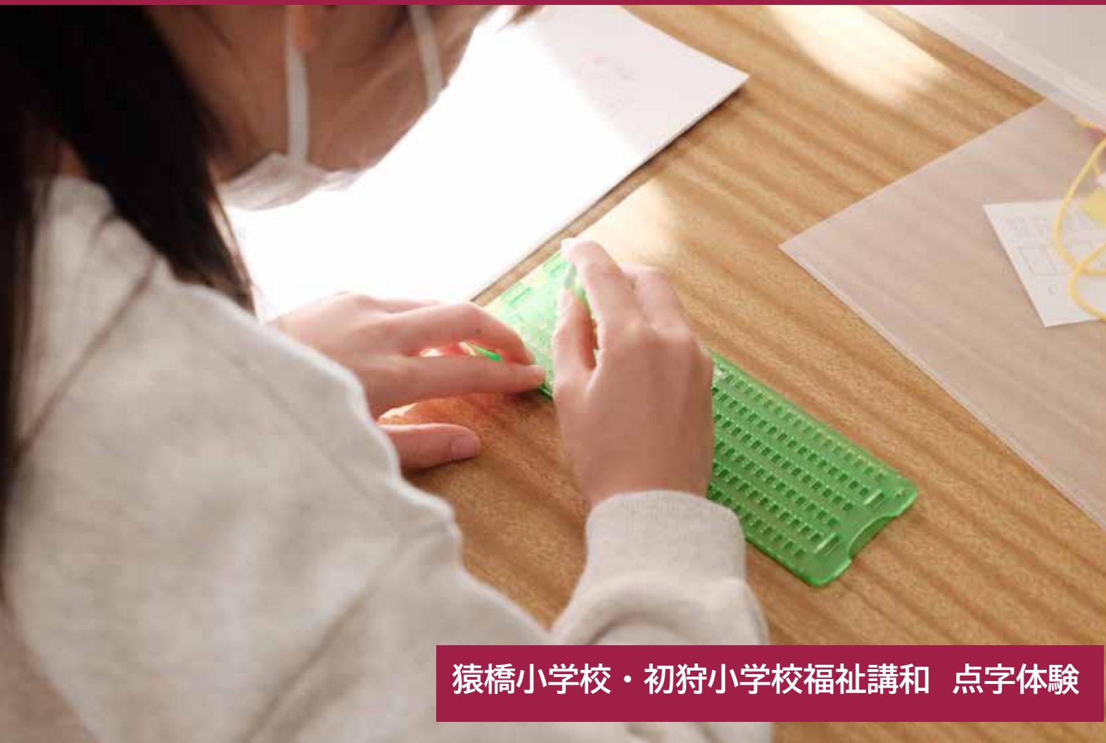
猿橋小学校・初狩小学校福祉講和 点字体験