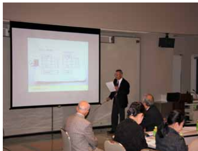
▲宇都宮市豊郷地区社協による視察研修の様子

プログラムにおいては、地元でボランティア活動をしてくださっている方々のご協力により、マジックや歌の披露など、幅広い内容で実施することができました。