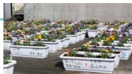
▲3地区社協（大月・真木・賑岡）と大月東小学校児童との植栽活動