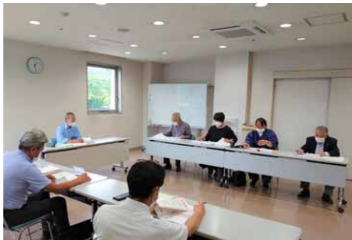
▲地域福祉活動計画推進委員会の様子

この地域福祉活動計画は、地域内のさまざまな社会資源と、住民や民間の福祉関係団体が行う活動を結びつけながら、地域の課題解