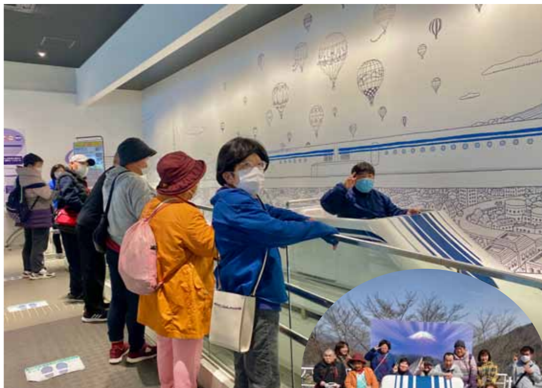
▲全員が浮上体験しました