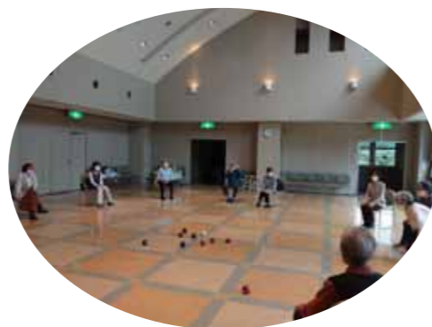
▲レクでリフレッシュ