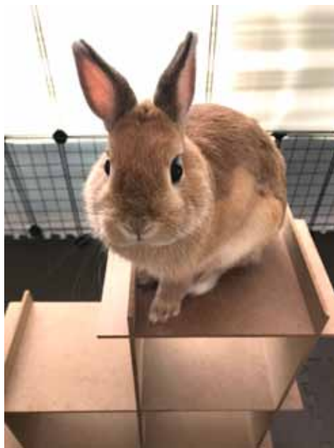
メルくん（ウサギ：9ヶ月）

我が家に来てもうすぐ一年。撫でられるのが大好きなネザーランドドワーフのメル君はみんなの癒し♡