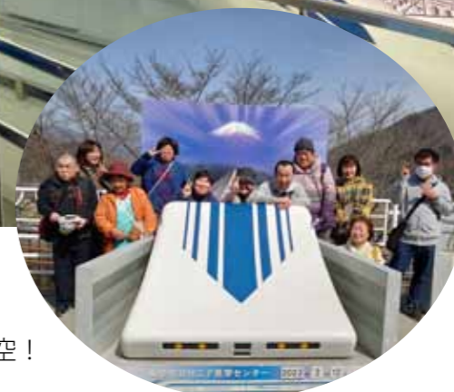
▶外は気持ちいい青空！

大月市社会福祉協議会では、障がい児者が誰でも参加できる交流の場として「ふー・ちよき・ぱー」を開催しています。例年4回ほど体操や工作、遠足などの様々な内容で活動しています。今年2回目は、「リニア実験センター」の見学と「道の駅都留でお買い物」ツアーを実施しました。初めて見学に来られた方、何度も来ている方、それぞれ様々な楽しみ方がありますが、この日は日曜日でしたので実験線の走行はなく残念でした。見学センターでは「リニアモーターカーに乗れる!？」と期待して来られた方もいましたが、ミニリニアに乗って磁気浮上走行を体験しました。感想「浮いているよ！面白いね♪ふしぎな感じ！」 参加者の多くが、施設通所やお仕事に通うため、どうしてもこの行事は日曜日が中心となっています。福祉センターで行う時には、保護者の勉強会「大月ネットワーク会議」を行うこともあります。障がい者やご家族の皆様、一緒に活動してみたいというボランティアの皆様、ご興味ある方、いつでもご登録いただけますので、ぜひご連絡ください♪ 次回は、5/21(日) 10:00~11:30 「春の空気を吸って体操をしましょう！」(場所…桂川ウエルネスパーク/雨天の場合は福祉センター)です。ぜひ、ご参加ください！