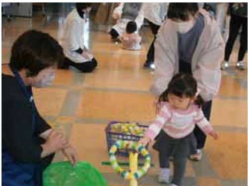
▲主任児童委員の活動の様子

「自分の住み慣れた地域で最期まで」そう思っている方は多くいらっしやることと思います。民生委員・児童委員はこの思いを実現するため、住民の皆様の支えとなる活動を行っています。「悩み事があるけど誰に相談していいのかわからない：」そんな時は民生委員・児童委員に声をかけてみてください。解決に向けてきつとお役に立てるはずですよ。