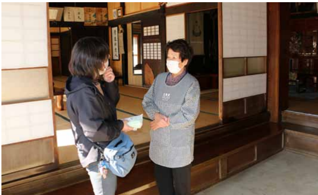
▲訪問している様子

最近では地域でのつながりが希薄化しており、子育てや介護の悩みを抱えている方、障害のある方、地域で孤立してしまっている方がいらっしやいます。そんな方々が必要な支援を適切に受けられるように民生委員・児童委員が身近な相談相手となり、行政や専門機関へのパイプ役を務めています。