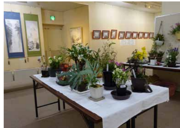
▲老大祭 (園芸部・水墨画部)

老大祭では6サークルの学生が展示部門に出品し、また、1階大ホールの舞台では8サークルの学生が、発表部門に出演し1年間の学習の成果を皆さんに披露しました。3年ぶりの開催に学生の方は緊張の中にも充実したひと時を過ごしていました。