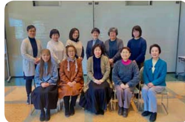
▲講師と修了生の皆さん

今年度もコロナ対策を行う中で、広いスペースのある6階多目的ホールで講座を開き、1年間40回の講座を予定通りに行うことができました。受講生はお互いに影響し合いながらモチベーションを高め、さらに技術向上とコミュニケーション能力アップのため、次のステップを望まれる方、市内外のろうあ者との交流を積極的に進められる方々がいて、今後の活躍がとて頼もしく思われる皆さまでした。 修了式後には「毎回楽しみだった！」「緊張するけれど毎回充実していた」「一年間楽しく学べ、もっと学びたい意欲が沸いた」との感想をいただきました。1年間、真摯に手話、聴覚障害について向き合ってくださり、ありがとうございました。