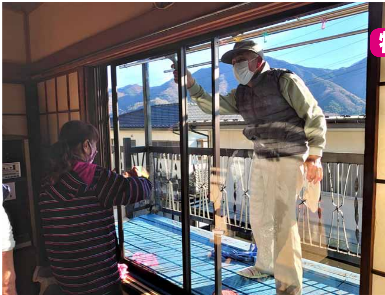
▲お助け隊の隊員が窓ふきをしている様子