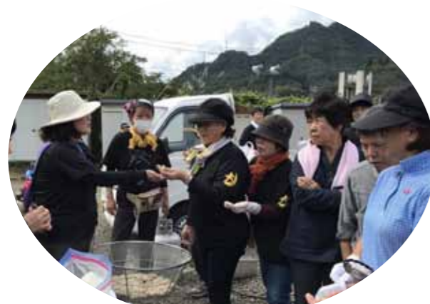
▲災害ボランティア講座

一、介護保険事業所（居宅介護支援事業所・訪問介護事業所・通所介護事業所）にあたっては、健全な経営と更なるサービスの質の向上に努めます。また、「地域福祉推進役である社協の事業所」として、相談援助活動を意識して取り組む中で、利用者と地域との関わりにも目を向けて、あらゆる職種との連携を大切に、新たなニーズ等の発見や資源開発などの地域づくりに努めます。