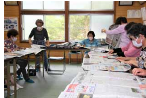
▲ふれあいいきいきサロン