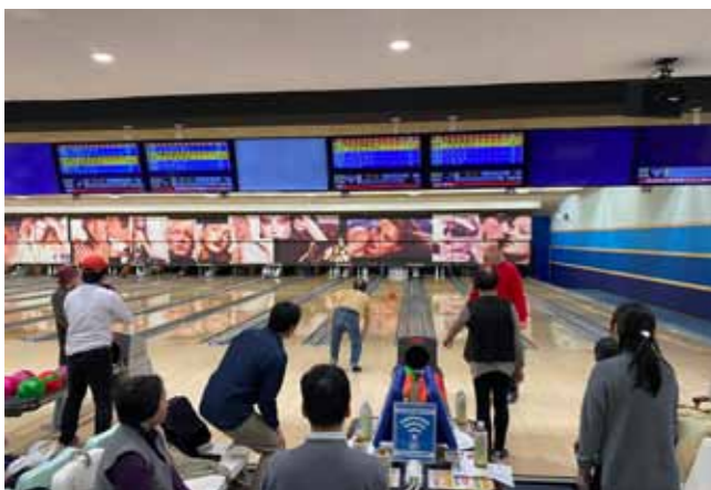
▲障がい者ボウリング大会