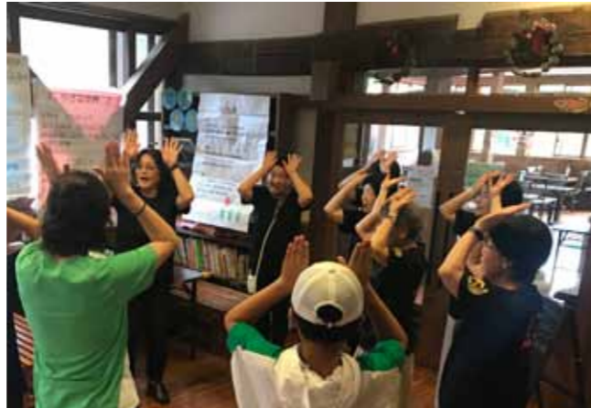
▲夏休みボランティア講座