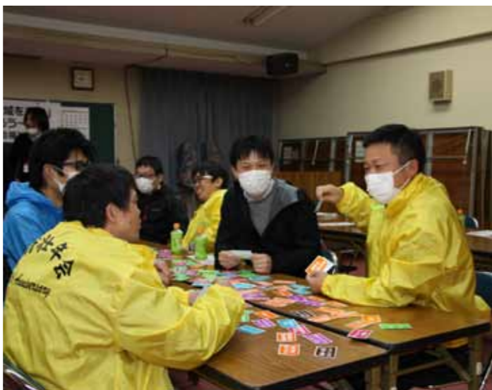
▲みんなで話し合う様子 (成人学級)

そして、会長が企画する今年度の成人学級は、単発でなく継続的に、この辺りを意識していきたいような学びの場を創ることを、計画したようである。