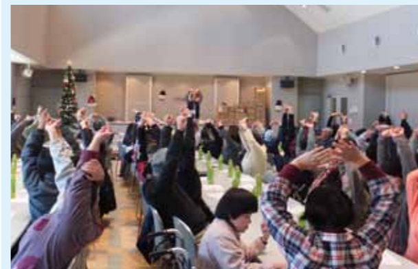
▲クリスマスのつどい

※入会希望者は、入会申込書に記入の上、市社協地域福祉担当に提出して下さい。 入会申込書は、大月市社会福祉協議会、大月市役所障害者支援担当に置いてあります。