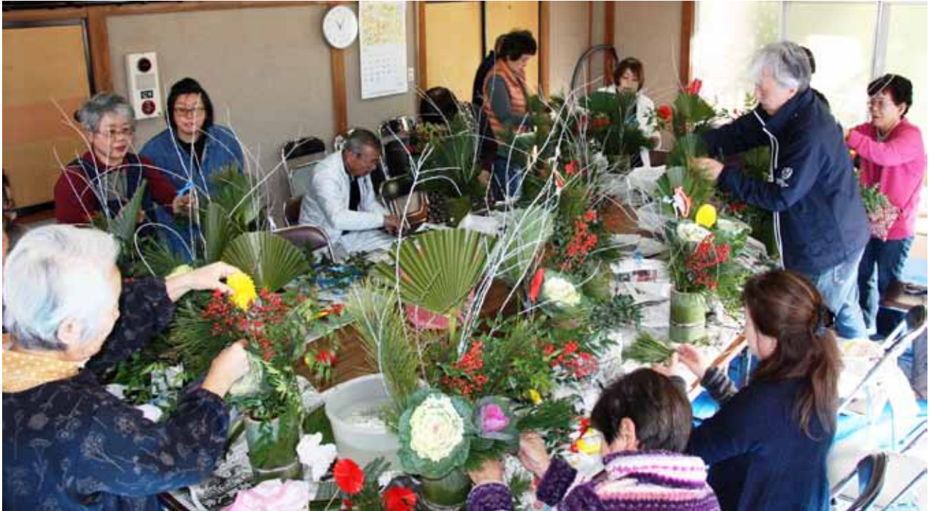
▲沢井地区 正月飾りづくりをしている様子